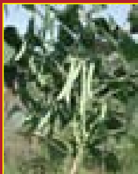
Vainas de la variedad Tonjibe